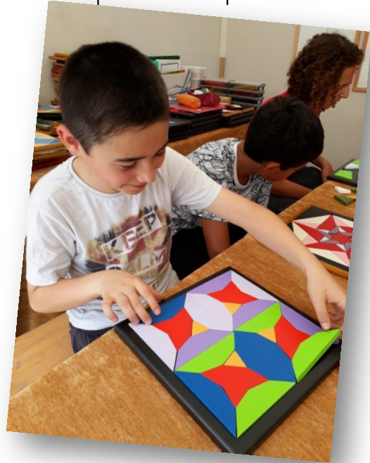
Réalisation de puzzles géométriques