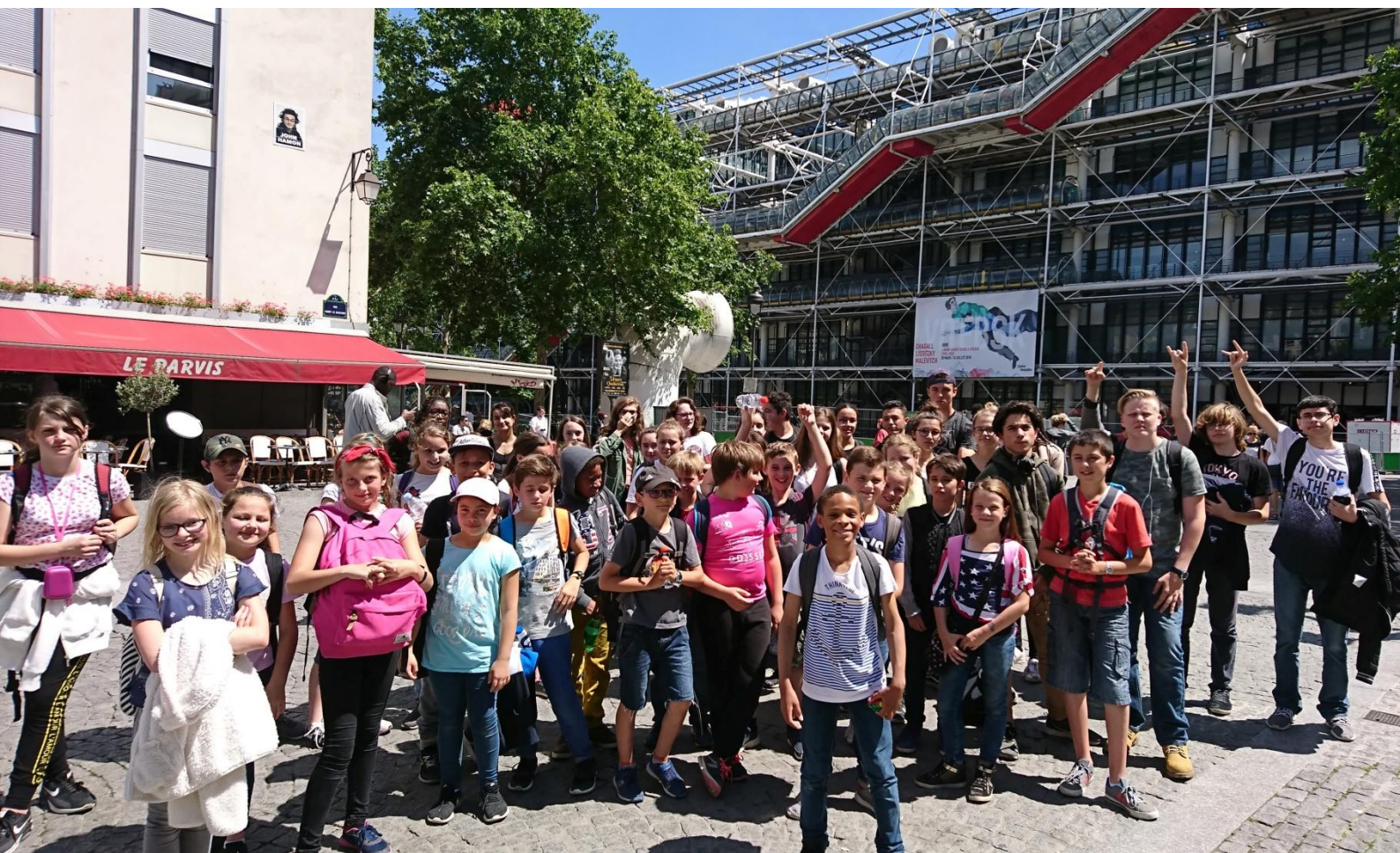
Les élèves de 3eA et de CM2 posent devant le Centre G. Pompidou à Paris.

L'opération s'inscrit dans le cadre du PEAC et du Parcours citoyen.