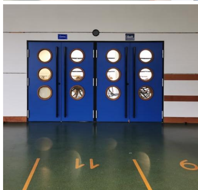
« ŒUVRES DISCRÈTES » - NIVEAU 3 ME