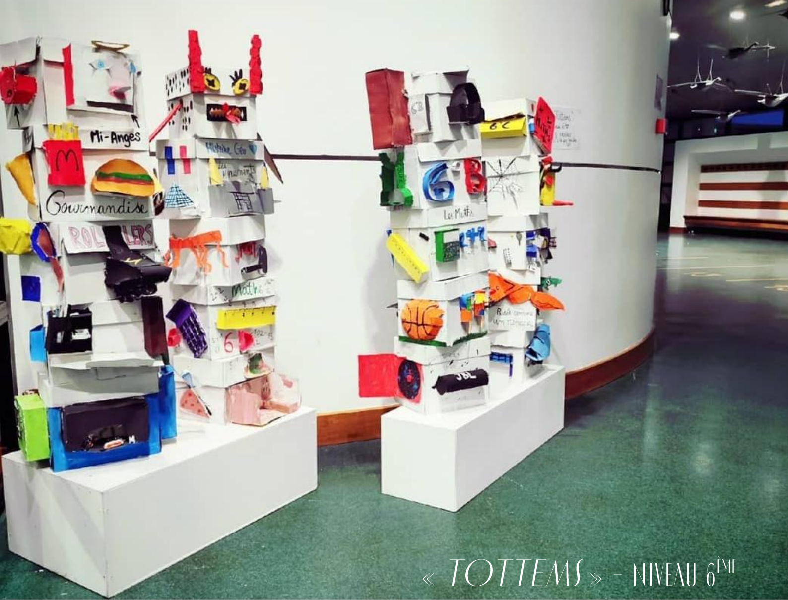
« TOTTEMS » - NIVEAU 6 MI