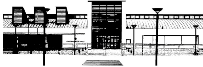
COLLEGE CHARLES DE GAULLE – B0