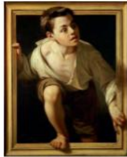
Pere Borrell del Caso , Echappant à la critique , 1874

Œuvre qui intègre divers objets dans une surface de toile peinte, créant une sorte d'hybride entre la peinture et la sculpture.