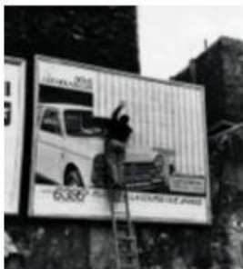
Daniel Buren , Affichage sauvage , 1968