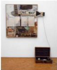
Robert Rauschenberg , Black Market , 1961