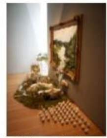
Grégory Euclide , Otherworldly optical delusions and small realities , 2011