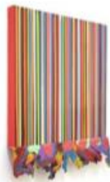
Cédric Tesseire , Alias (série) , 2006