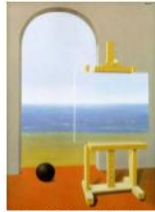
René Magritte , La condition humaine , 1935