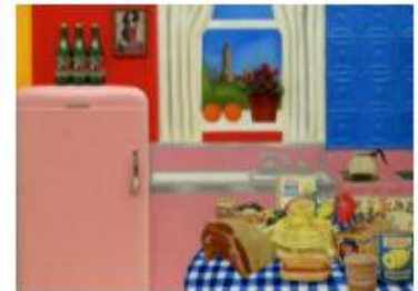
Tom Wesselmann , Still life n°30 , 1963