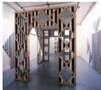
Daniel Buren , Cabane éclatée deux fois , 1990