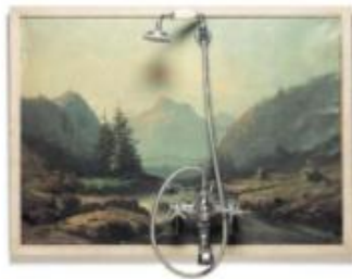
Daniel Spoerri , La douche, détrompe l'oeil , 1961