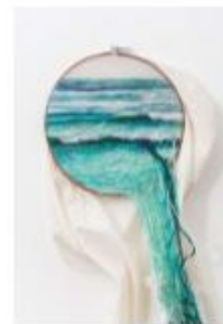
Ana Teresa Barboza , Suspension 1 , 2012