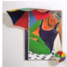
Martial Raysse , Souviens toi de Tahiti , 1963