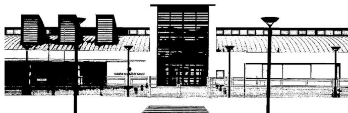
COLLEGE CHARLES DE GAULLE - B0