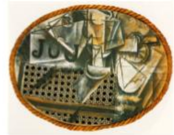
Pablo Picasso , Nature morte à la chaise cannée , 1912