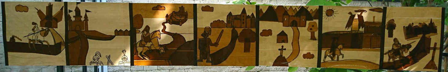
Parcours des Semes A