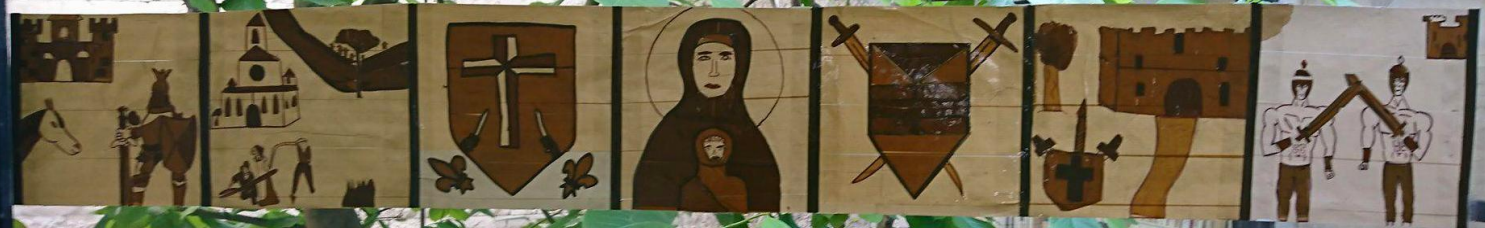
Parcours des Semes C