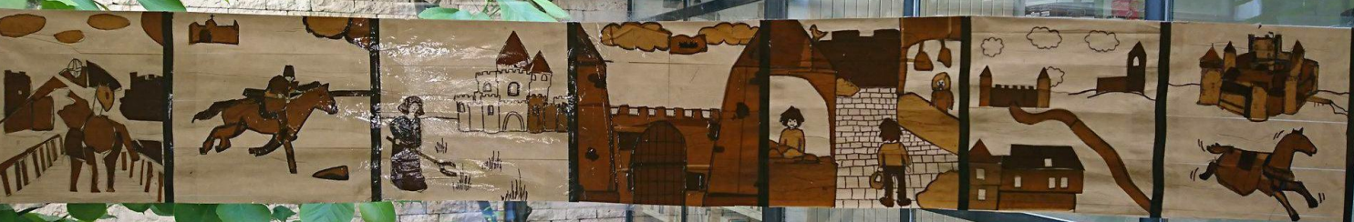
Parcours des Semes D

Outils et matériaux à la disposition des élèves :