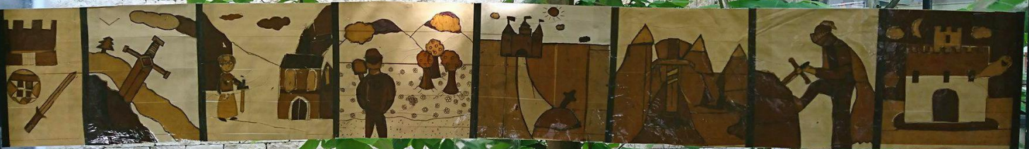
Parcours des Semes B