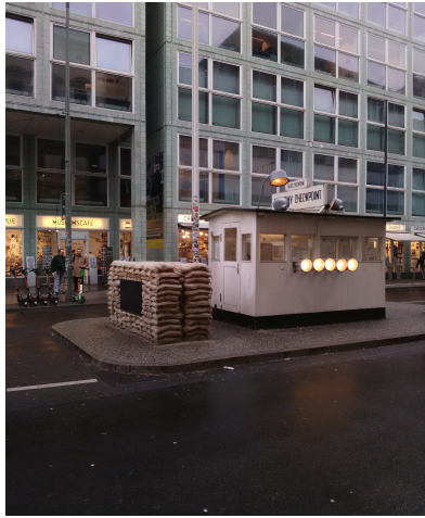
Le Checkpoint Charlie