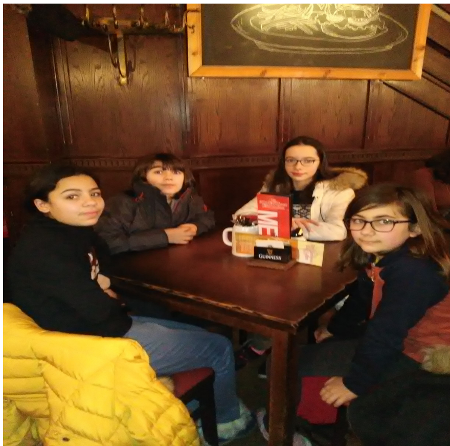
En attendant le chocolat chaud et l'Apfelstrudel !