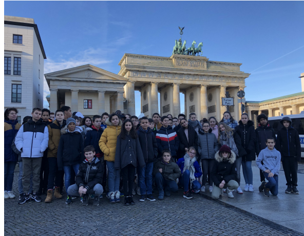
Photo de groupe