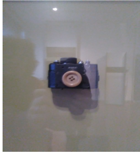
Appareil photo truqué