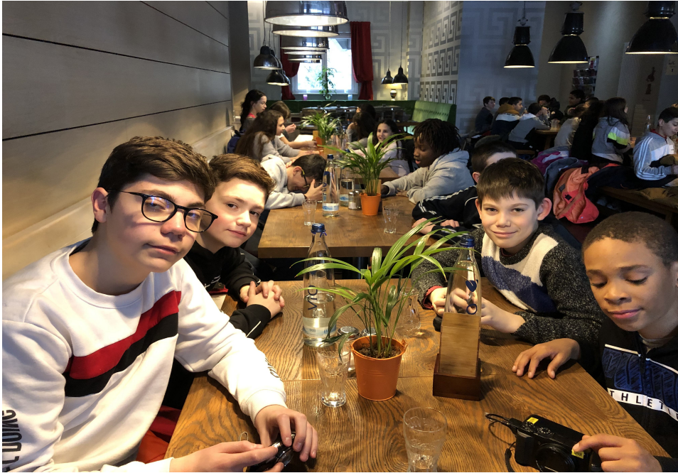
Au Restaurant « Kantine de Luxe »