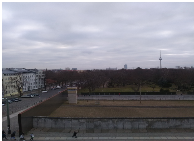
Le Mur vu de Berlin-Ouest, Bernauer Straße