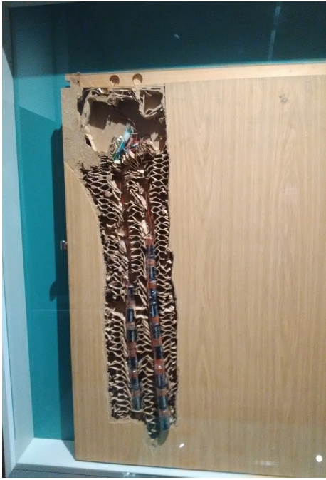
Attention ! Appartement sous écoute !