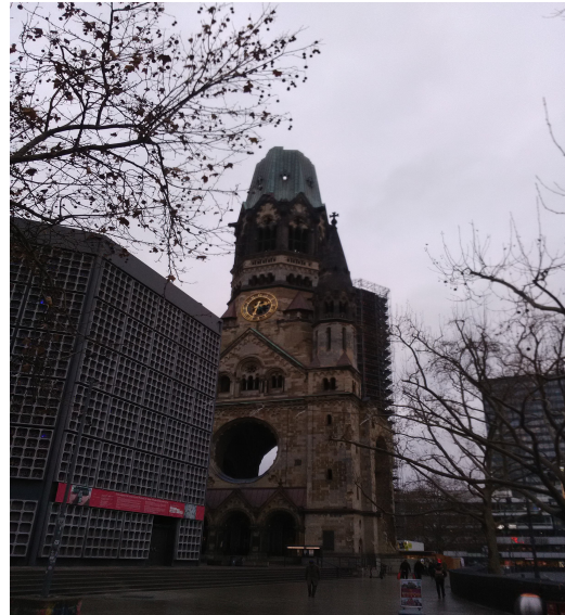
L'Eglise du Souvenir de l'Empereur Guillaume Premier