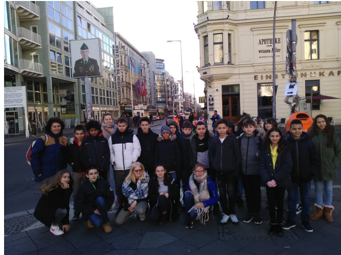
En passant par le Checkpoint Charlie