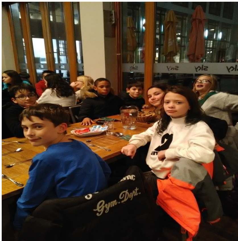
Au restaurant le dernier soir