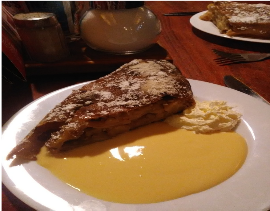
Apfelstrudel mit Vanillesauce : une spécialité autrichienne en plein cœur de Berlin