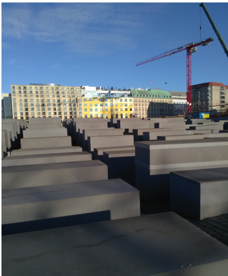
Le Mémorial aux Juifs assassinés d'Europe