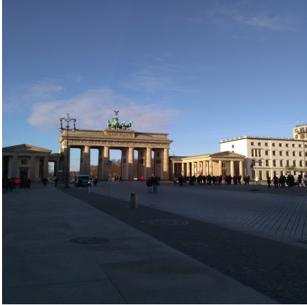
La Porte de Brandebourg