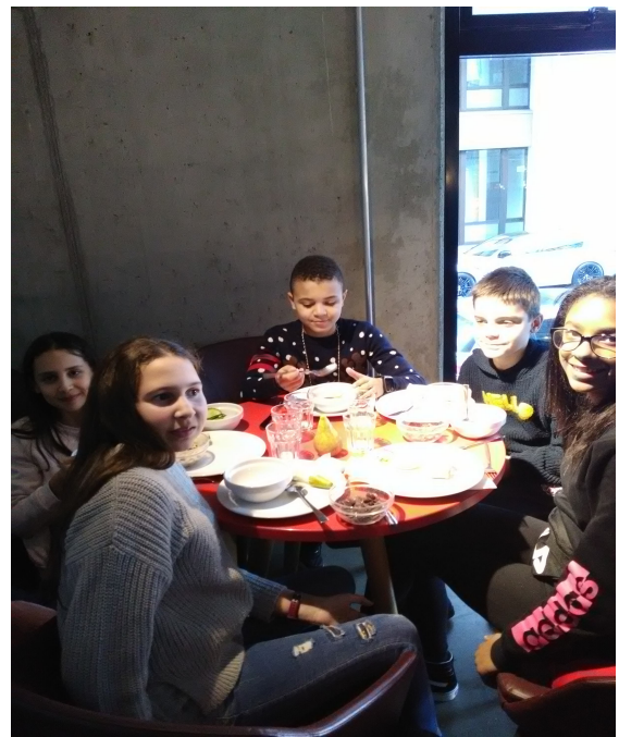
Petit déjeuner à l'auberge