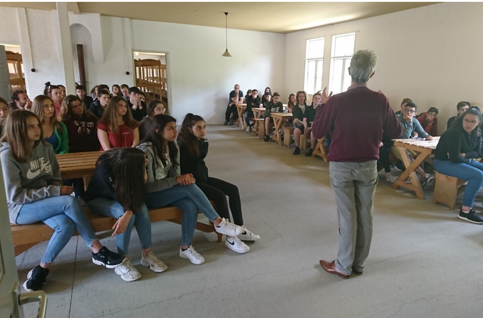
CAMP DE CONCENTRATION DE VUGHT