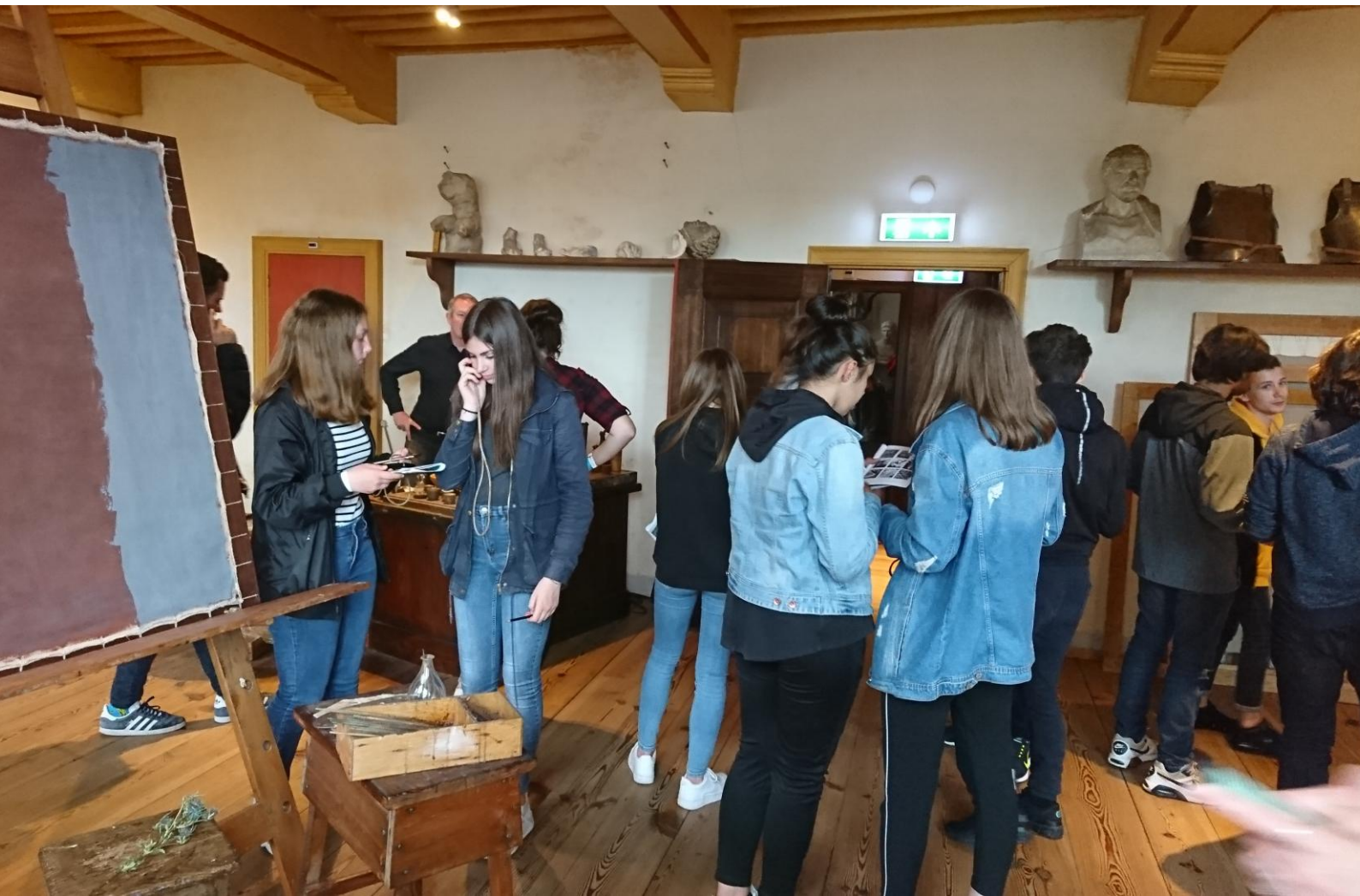
MAISON DE REMBRANDT